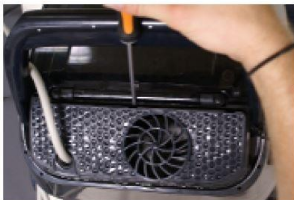
Ochrannou mřížku odstraňte plochým šroubovákem

Nečistoty na oběžném kole mohou způsobovat přehřátí zařízení a jeho následné poškození. Při zanešeném oběžném kole klesá výkon vysavače. Vizuální kontrolu oběžného kola provádějte po každém vysávání.