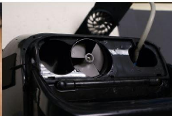
Vyčistěte oběžné kolo a znovu osadte mřížku